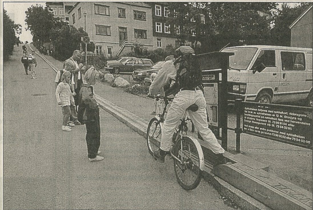
Die Weltneuheit «Fahrradlift» von Trondheim.